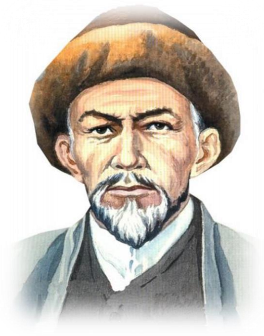
Мифтахетдин Акмулла (1831 – 1895)

Информационно – библиографический сектор