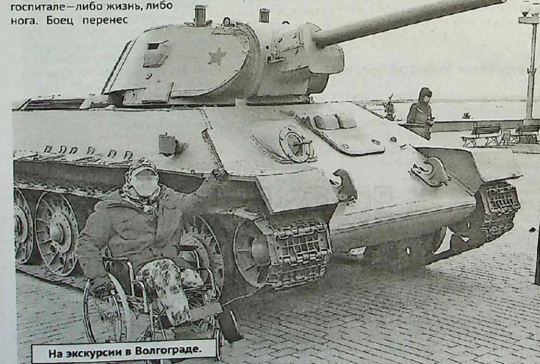
На экскурсии в Волгограде.

комиссариата РБ (г.Уфа, ул.Революционная, 156)