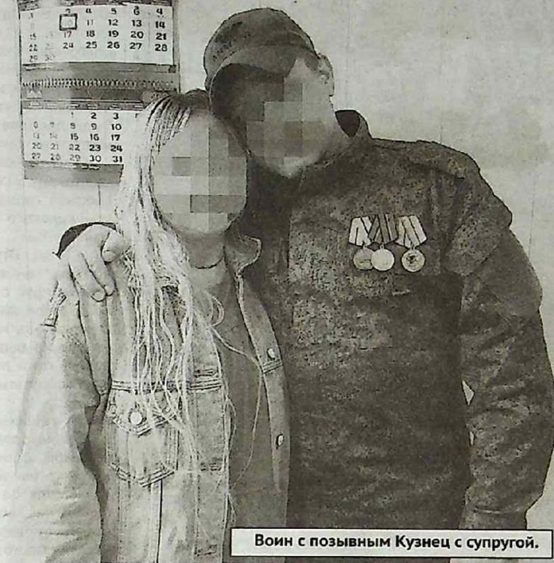
Воин с позывным Кузнец с супругой.