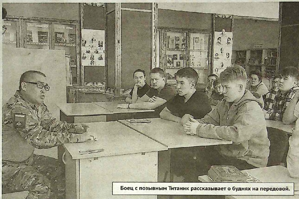
Боец с позывным Титаник рассказывает о буднях на передовой.

Молодому поколению было интересно услышать о службе бирянин и условиях их жизни за ленточкой. Вспоминая погибших боевых товарищей, воин с трудом сдерживал эмоции. Рассказал студентам о времени, проведенном на передовой, отметил, что им руководило при непростом решении отправиться на защиту Отечества, о боевых буднях. Выразил признательность за поддержку из дома, отметив, что благодаря посылкам и письмам в гумконвоях бойцы очень сильно